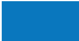
084 Sky blue Himmelblau Bleu ciel