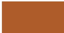
083 ~RAL 8023 ~HKS 81 Nut brown Haselnussbraun Brun noisette