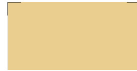
023 Cream Creme Crème