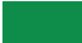
062 Light green Hellgrün Vert clair