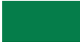
068 ~HKS 57 Grass green Grasgrün Herbe