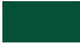
613 Forest green Waldgrün Vert forêt