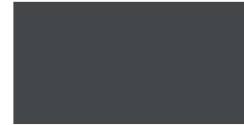
073 ~RAL 7043 ~HKS 92 Dark grey Dunkelgrau Gris foncé