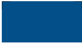
051 ~HKS 44 Gentian blue Enzianblau Bleu gentiane